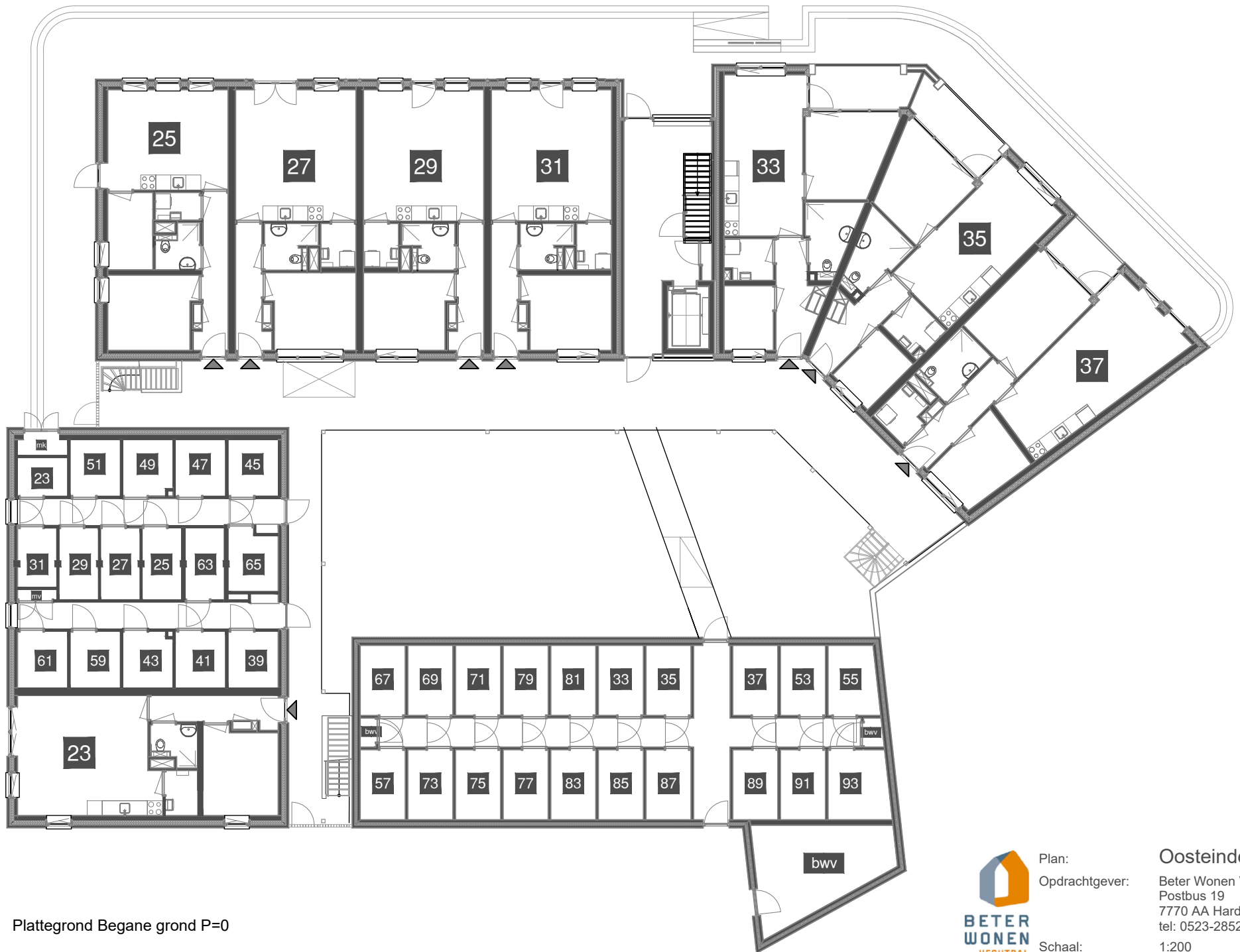
Plattegrond Begane grond P=0