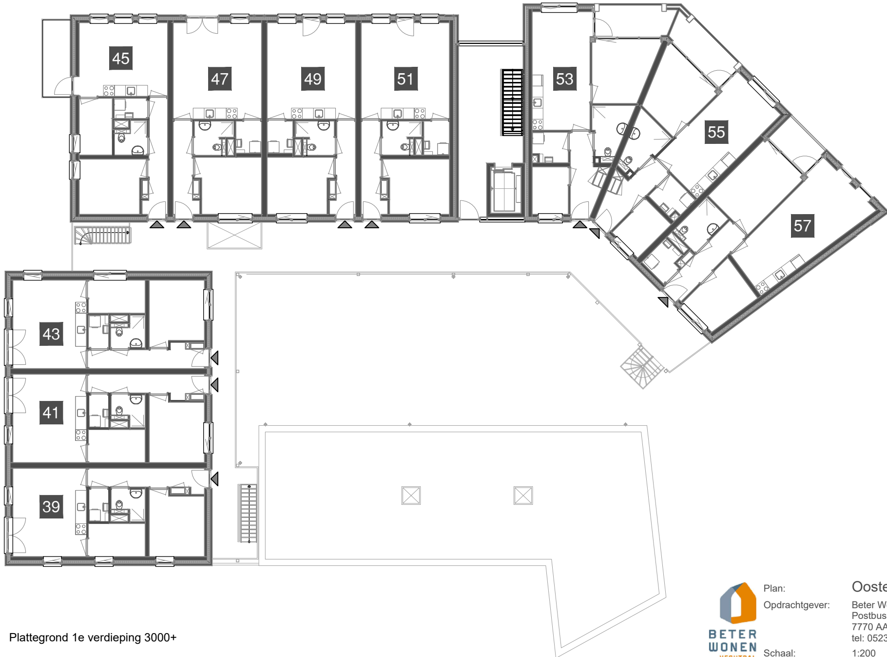
Plattegrond 1e verdieping 3000+